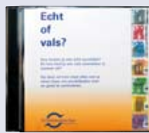
'Echt of vals?' cd-rom met de echt- heidskenmerken van de eurobiljetten