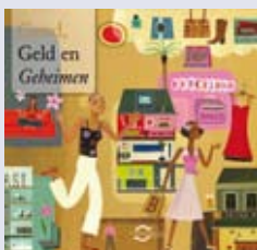
'Goud, Geld en Geheimen' publieksbrochure